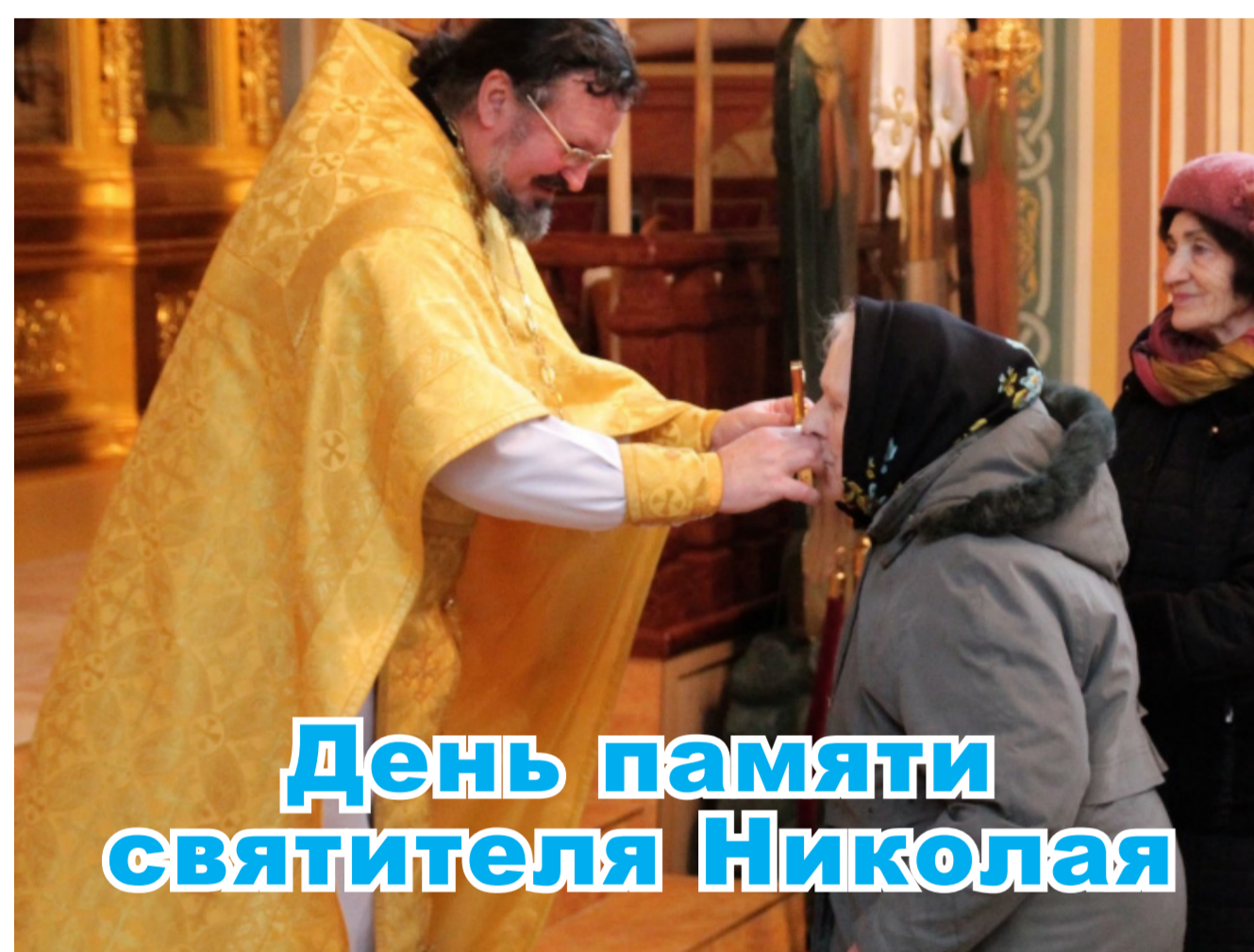
День памяти святителя Николая