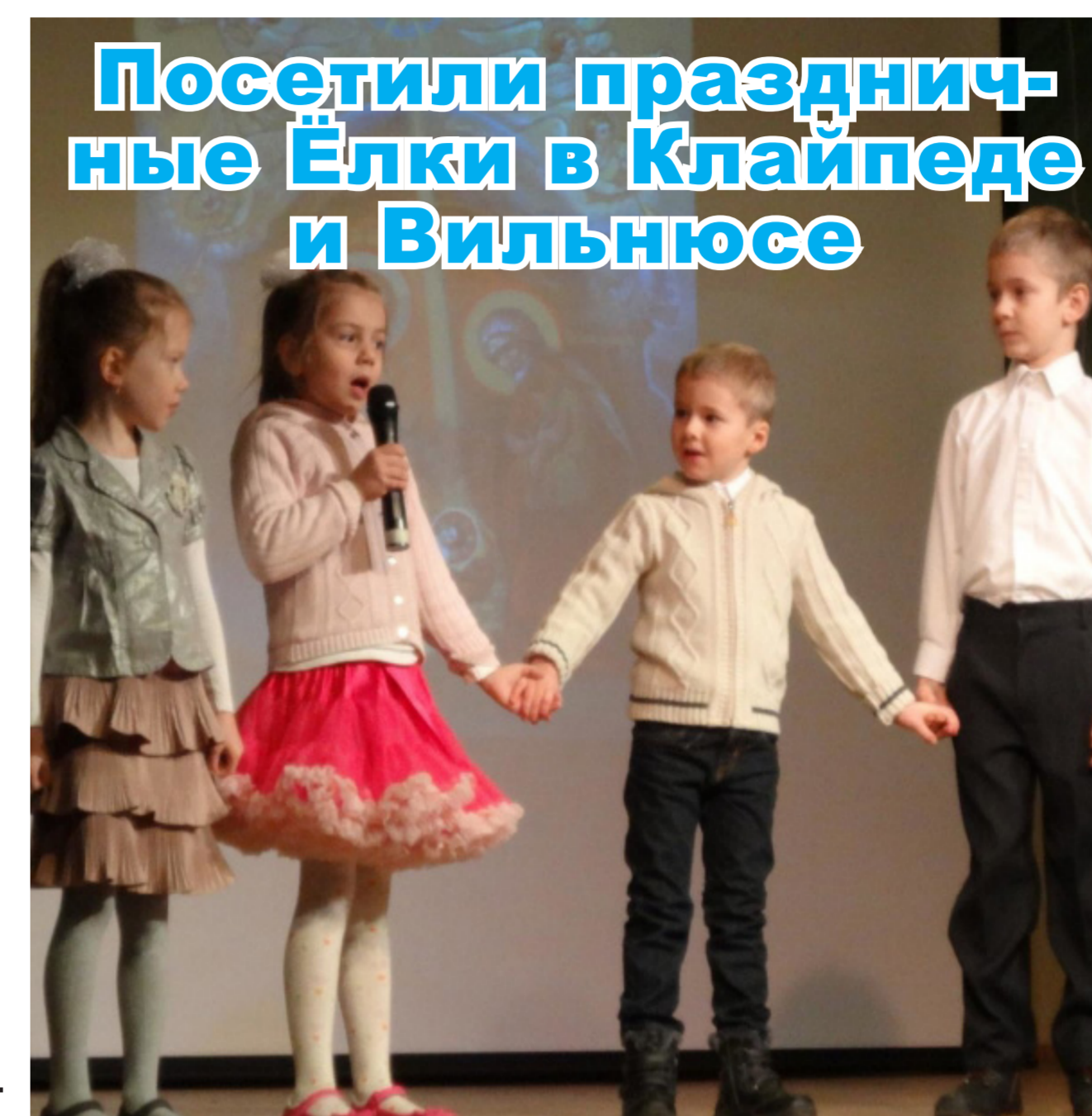
Посетили праздничные ёлки в Клайпеде и Вильнюсе