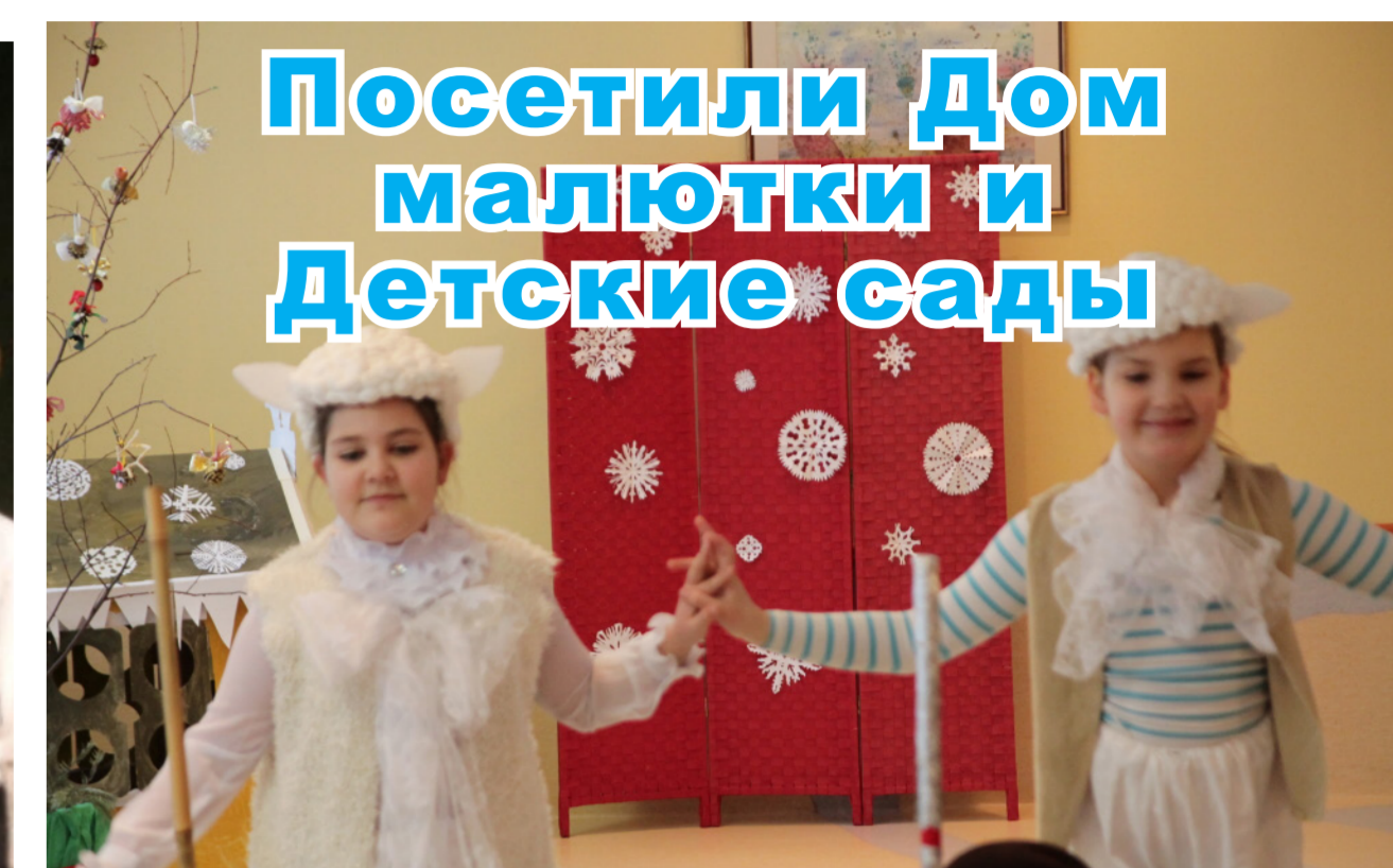
Посетили Дом малютки и Детские сады

19 декабря в храме Всех святых, в земле Российской просиявших состоялась Божественная литургия в день памяти святителя Николая, архиепископа Мир Ликийских. Божественная литургия в день памяти святителя Николая, архиепископа Мир Ликийских. Святитель Николай, живший в 3-4 веках, прославился как великий угодник Божий, поэтому в народе его обычно называют Николаем Угодником. Святитель Николай считался «всех предстателем и заступником, всех скорбных утешителем, всех сущих в бедах прибежищем, благочестия столпом, верных поборником». Христиане верят, что и сегодня он совершает множество чудес в помощь молящимся ему людям.